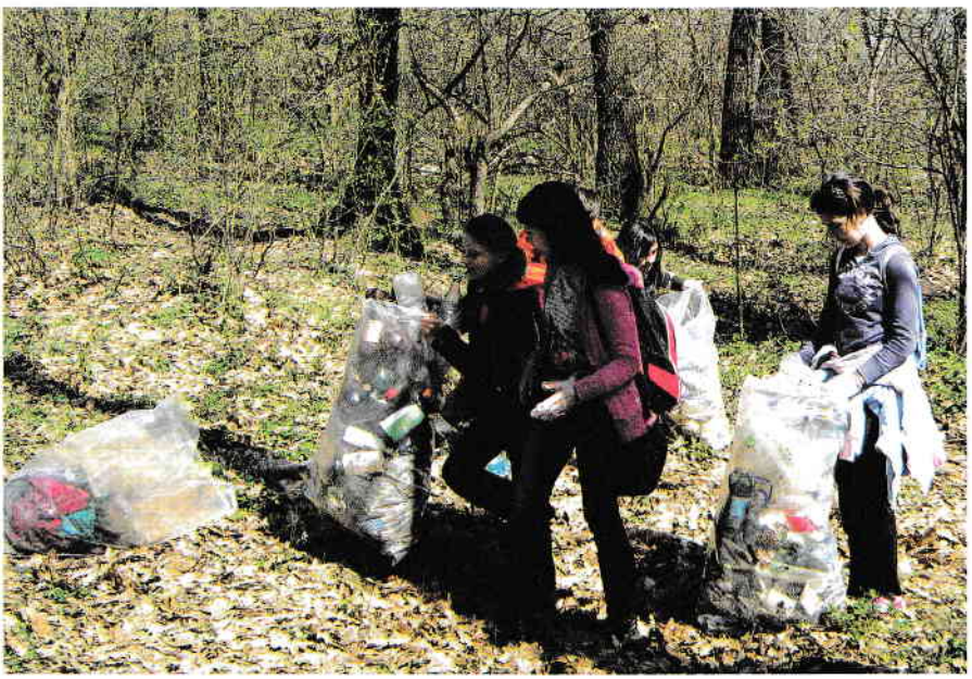
Activitate de ecologizare a pădurii